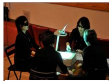
福祉大会での活動の様子