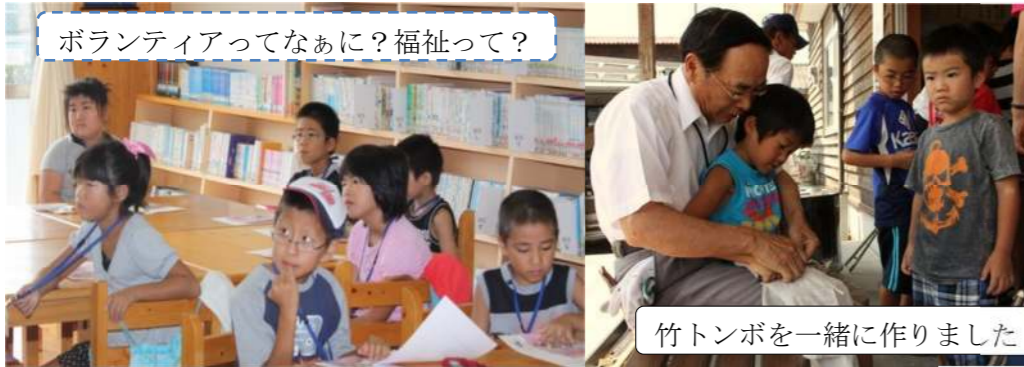
ボランティアってなあに？福祉って？