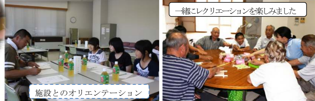
施設とのオリエンテーション