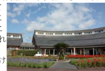
弥五郎伝説の里ロータリー

弥五郎どんが見下ろす弥五郎伝説の里でグラウンドゴルフの練習をするようになり、市職員が園内を管理されているのを見て、「自分たちにも何かお手伝いできたらいいな」と考えるようになりました。花好きの主人が、「健康ふれあい館玄関前のロータリーを真っ赤な花園にしてお客様を迎えられないか」と打診したところ、快くOKを頂き、ロータリーのまわりに真っ赤なサルビアを植えたのがボランティアの始まりでした。平成15年に「ときわ木はつらつ塾」を受講した際、「ボランティアは継続が大事だ」と悟り、花づくりを続けるために仲間作りを始めました。花好きの知人やサロンのメンバーなどに声をかけ、だんだんと輪が広がっていきました。平成19年3月に「なごみ会」と名前がつき、現在では毎回メンバーと社協職員の方と一緒に、楽しい雰囲気の中、種まきから苗の植え付けまで行っています。毎年、立派に育った花の精たちが風に揺られてあいさつしてくれて、心がなごみます。今後も更になごませて頂けたら有難いです。感謝！感謝！です。