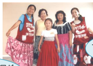
一緒にフラダンスを踊りました

自分に何ができるのかとても心配でしたが、人生で心に残る経験をたくさんさせていただきました。骨組みだけになった家の瓦礫撤去や、道路脇の側溝の掃除、仮設住宅で生活されている方々の孤立を防ぐため集会を開いたり、一緒にフラダンスを踊ったりもしました。作業をしている私達に手を合わせ、涙を浮かべながら「ありがとう」と言われる被災者の方々の姿を見て、本当に来て良かったと心から思いました。