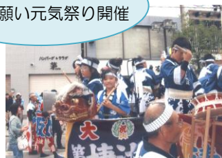
ボランティアと市民が復興を願い元気祭り開催