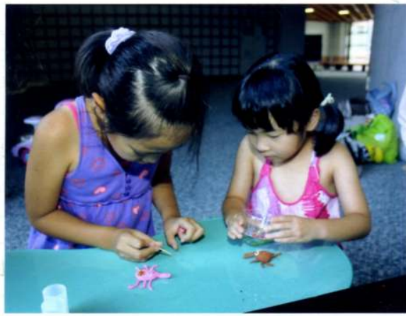
。今までのたくさんママと子どもたちのふれ合いから、私たちが多くの事を学び、今、サロンも新しい形を模索中です。